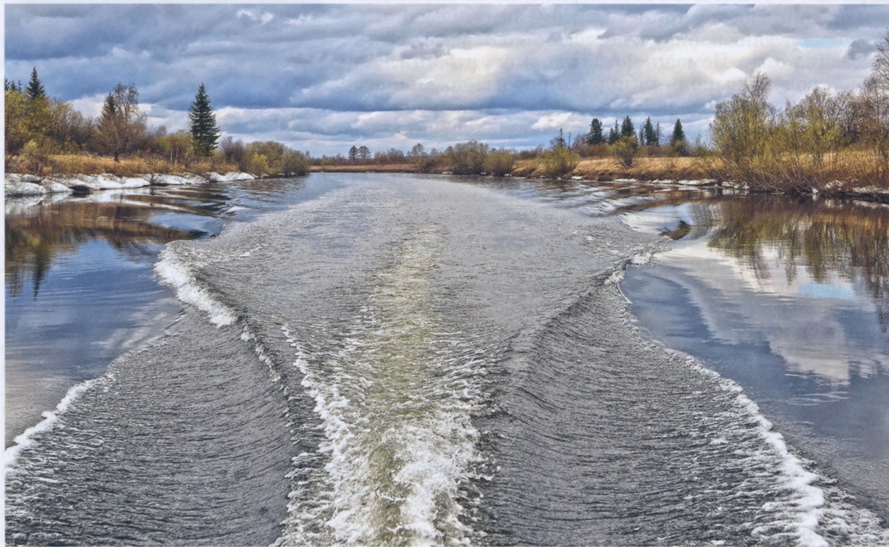
Ангара, Малиновая протока. 2012.

10 сентября 1931 года постановлением Кежемского РИКа был выдвинут на должность секретаря Кежемского райисполкома. В феврале 1932 года был послан на работу в Кежемскую